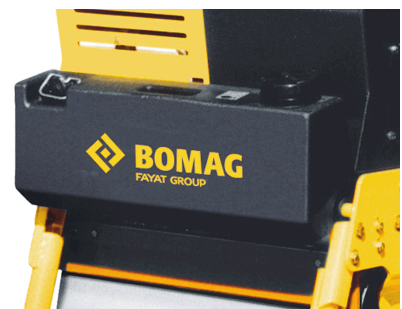
Kein Anhaften auf Asphalt Wasserberieselung mit großem Wassertank (standard)