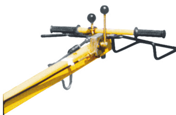
Präzise und sicher bedienbar Alle Funktionen am Deichselkopf integriert